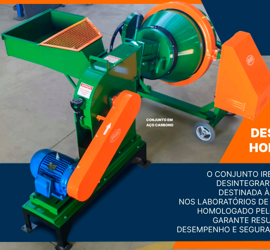
CONJUNTO EM AÇO CARBONO